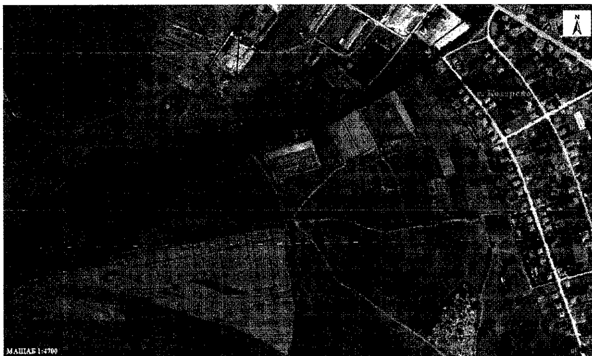
Местоположение на имотите (със син фон), в които е предвидена промяната

5. Карта или друг актуален графичен материал на засегнатата територия и на съседните и територии, таблици, схеми, снимки и други - по преценка на възложителя, приложения: