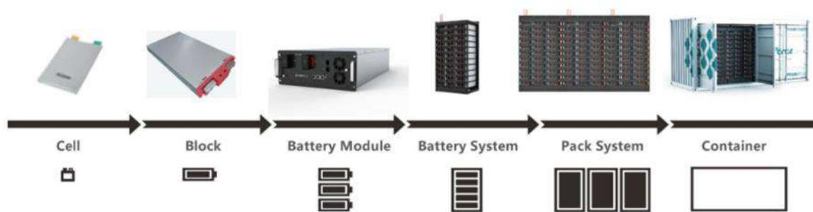
фигура 1 Система за съхранение на енергия ще е разположена в контейнер

Ще се изгради на нова подземна кабелна линия (КЛ) 20 kV тип 3X na2H5(F)2Y 1x400 m 2 , с дължина L=5 700 m, разположена в сервитута на полски път ПИ 02837.5.1213, второстепенна улица ПИ 02837.501.9540, път от републиканската пътна мрежа ПИ 02837.501.9501 и местен път ПИ 02837.501.9502, ПИ 02837.14.525 до РУ 20 kV на п/ст ВЕЦ „Батак“.